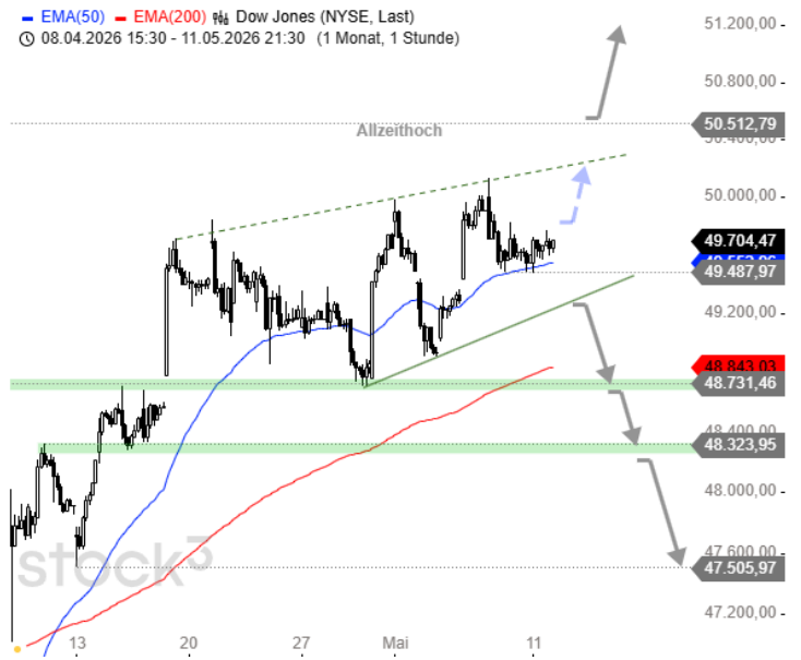
Entwicklungen in der Vergangenheit sind kein Hinweis für künftige Erträge und der Wert einer Investition in ein Finanzinstrument kann sowohl fallen als auch steigen. Investoren erlangen möglicherweise nicht ihren ursprünglich investierten Betrag zurück. Es wird ausdrücklich darauf hingewiesen, dass sich die dargestellte Wertentwicklung auf eine simulierte frühere Wertentwicklung des US beziehen und dass die frühere ebenso wie die simulierte Wertentwicklung kein verlässlicher Indikator für künftige Ergebnisse ist.

Für bullische Impulse müsste der Dow Jones über die Zwischenhochs der letzten beiden Handelstage ansteigen. Dann wäre Platz für eine Aufwärtsbewegung zur potenziellen Pullbacklinie (gestrichelt) und darüber zum Allzeithoch bei 50.513 Punkten. Ein Ausbruch auf neue Hochs würde größere Signale für die Bullen liefern. Auf der Unterseite würde ein nachhaltiges Abrutschen unter 49.480 kleine Verkaufssignale bringen. Dann könnten Abwärtskorrekturen bis 49.280 - 49.300 oder darunter 48.700 - 48.740 folgen. Unterhalb davon trübt sich die Situation deutlicher ein.